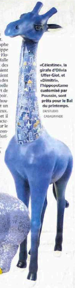
«Célestine», la girafe d'Olivia Offer-Glot, et «Dimitri», l'hippopotame customisé par Poussin, sont prêts pour le Bal du printemps.

Le Bal du printemps aura lieu le vendredi 20 mars (dès 18 h 30) à la Halle Sécheron. Inscriptions et achat de billets de tombola sur le site www.irp.ch