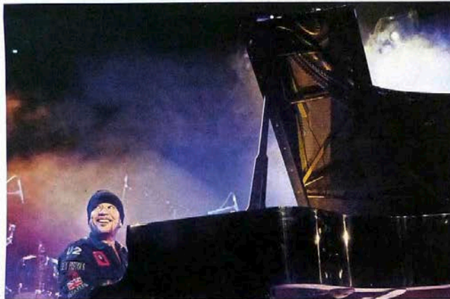
Pascal Obispo humain et chaleureux à la Fête de l'espoir.