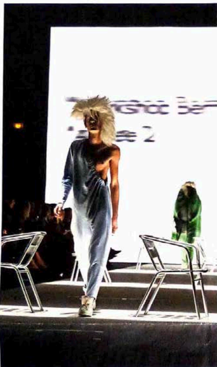
La HEAD, avec son défilé (à gauche), et le Bal du printemps - avec Patrick Bruel et Alain Delon en 2014 - sont des fidèles de la Halle Sécheron. Il s'agira désormais de trouver un plan B pour 2016!