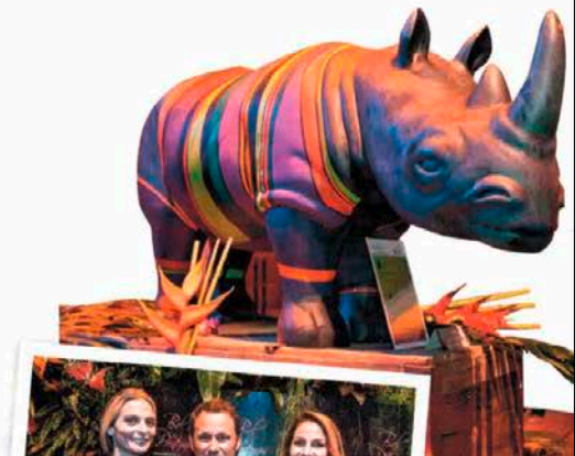
Le Rhino de l'artiste genevoise Béatrice Mazzuri.