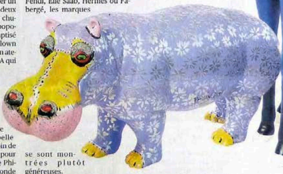
se sont montrés plutôt généreux.